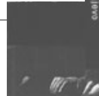
bilder oben- oben rechts: installation "target" im Kirchenschiff der lukaskirche luzern. kreuzgang mit 10 bildtafeln. fotografie auf plexiglas, auf gips -T-objekte 40 cm x 55 cm x 3 cm