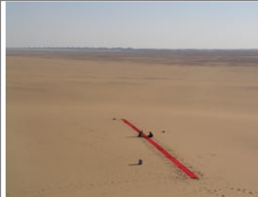
installation 1, „rote linie“ länge 138 meter.