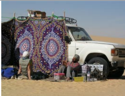
diskussionen über die welt, die wüste und das salz in der suppe.