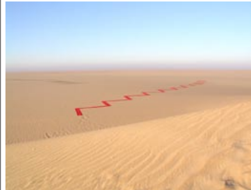
installation 2, „zick-zack linie“ ca 120 meter.