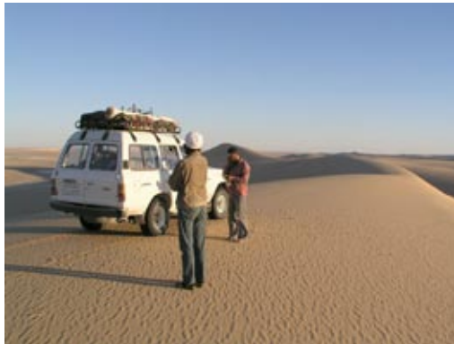
mobinile auch in der wüste, manchmal?