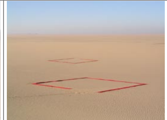
installation 3, „ost- und westhaus“ 2 x 18 x 18 meter.