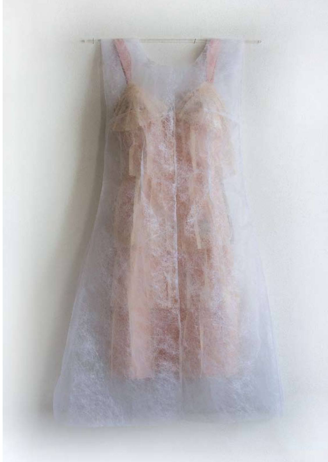
2012 portraits de femmes II – hommage à T.A. non-tissé, div. Mat., H 100 cm

Das Gedicht einer unbekanntenen japanischen Dichterin hat Monika Gasser 2012 rot auf den weissen Ofen im 2. Stock des Museums Bruder Klaus Sachseln geschrieben. Auch dieses Gedicht wird nach Ende der Ausstellung wieder gelöscht. Der beschriebene Ofen ergänzt das «Kleid für Dorothée» von 2001. Die Künstlerin hatte Dorothée, der Frau von Niklaus von Flüe, ein bodenlanges Kleid aus Japanpapier genäht. Das von innen beleuchtete Kleid verfügt über viele Taschen, die auf der Innenseite mit Texten beschrieben sind. Es sind Liebesgedichte, die für die Stärke und Souveränität Dorothées stehen. Diese Schreib- und Gedenkarbeit in Erinnerung an Dorothée verblasst im Lauf der Jahre, genauso wie die Erinnerung an die Gattin des Eremiten und Mutter seiner zehn Kinder über Jahrhunderte verblasste. Dass dieses Denkmal für die Frau, die ihrem Mann aus Achtung und Liebe seinen Weg freigab, erst als Leuchtkörper seine ganze Wirkung entfaltet, dass dieses Werk explizit auf materiellen Wert und zementierte Dauer verzichtet, dies unterstreicht seine Gültigkeit und verschafft ihm einen Platz in der Erinnerung der Besucher.