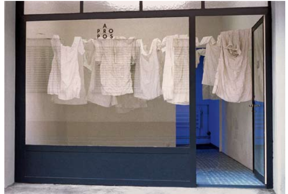
1998/99 Nachtfalten Installation Nachthemden mit genähten Falten Galerie APROPOS Luzern