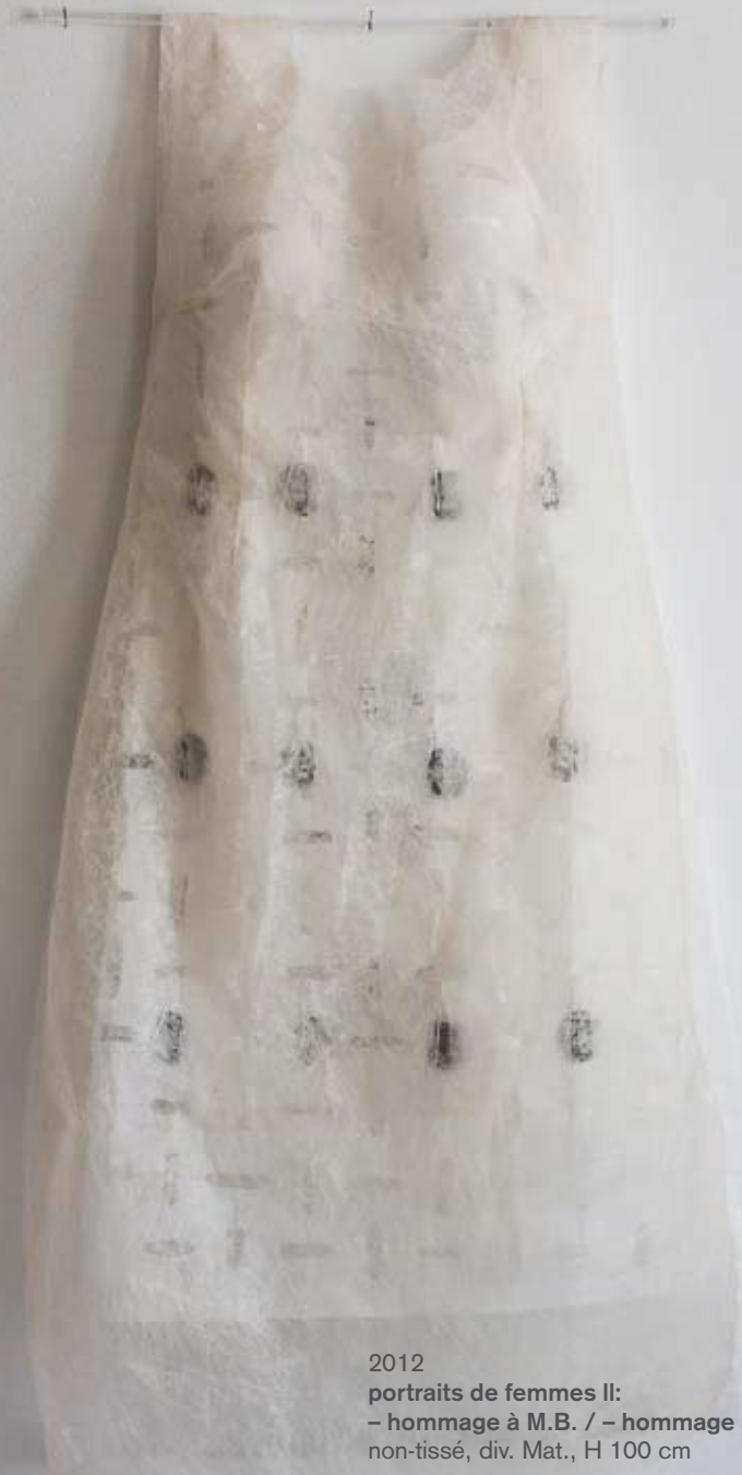
2012 portraits de femmes II: – hommage à M.B. / – hommage à M.K. non-tissé, div. Mat., H 100 cm