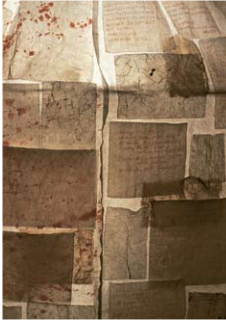
2001 Dorothee Installation mit Leuchtkleid Papier, Texte, Licht, H ca. 160 cm