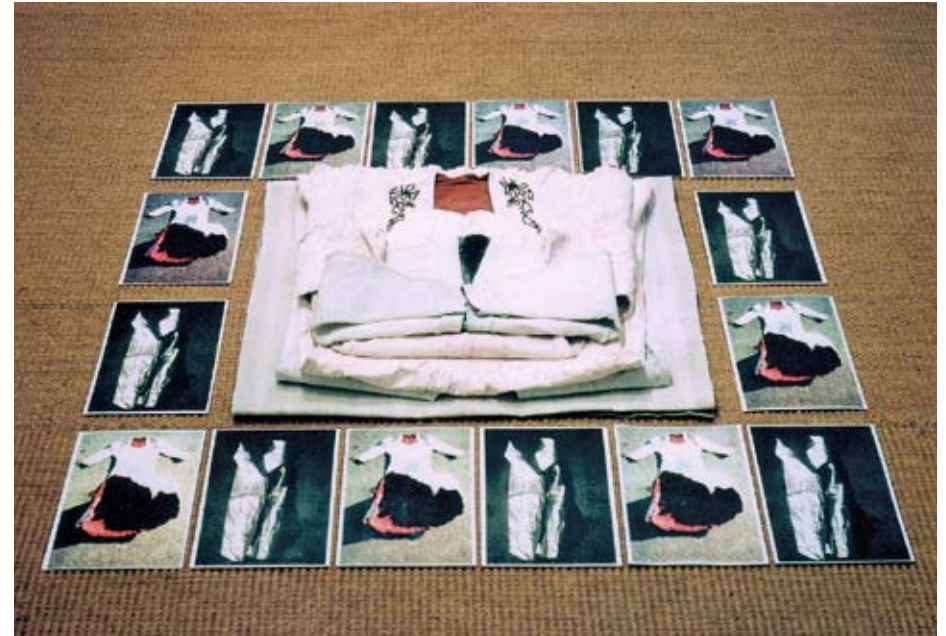
1991 Die Bärenhäuterin Installation mit eigenen Kleidern, Hasenhautleim, Pigmenten, Farbe, Fotos, ca.130x130 cm

Mit präzisen Schnitten löst die Bärenhäuterin das dicke Fell des wilden Tieres ab; entfernt sorgfältig Schicht um Schicht, bis sie zum innersten Kern vordringt. Erst dort zeigen sich die wahren Kräfte des Bären, und wer sich so weit vorgewagt hat, wird sich diese aneignen.