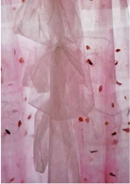
2000 sigala baile Papier, Tarlatane, Blüten, Pfeffer