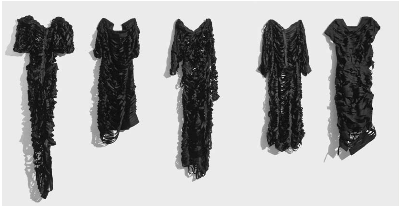
1993 Die kleinen Schwarzen 5 Cocktailkleider mit der Schere bearbeitet, div. Grössen