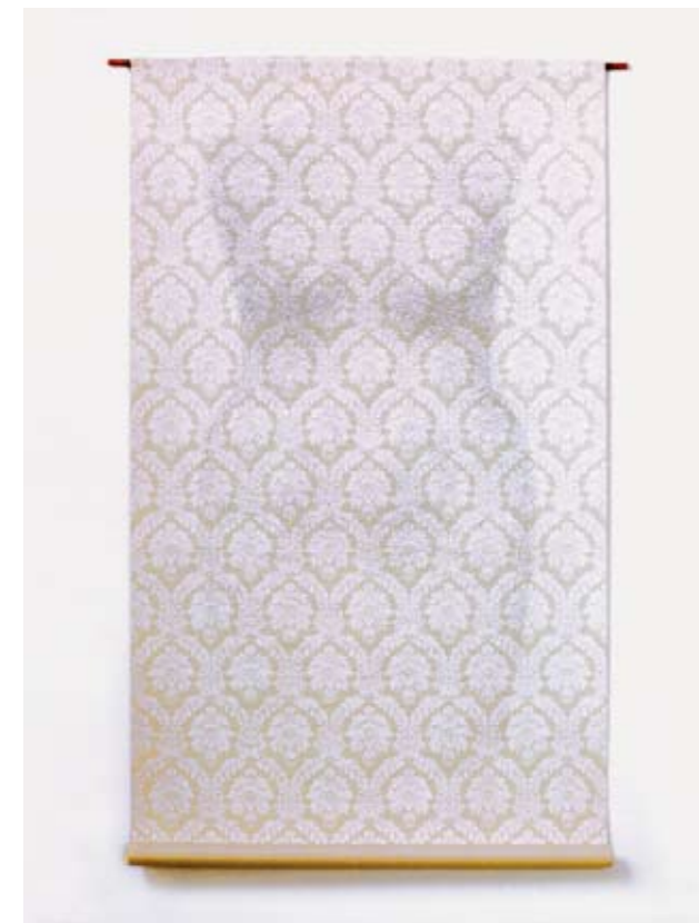
1996 Tapetenfrau (eine von 6) Zeichnung auf Tapete H ca. 135 cm

Les vêtements de Monika Gasser révèlent dans leur diversité tout un éventail de caractères humains et de mondes intérieurs. Ils témoignent d'une certaine proximité mais exigent également de la distance. Ils touchent, car leur créatrice observe avec précision et se « pend aux basques » de ses protagonistes. Ceci s'exprime aussi dans la dernière série de travaux qui fait écho aux « portraits de femmes » de 1998/99. Ces cinq hommages sous forme de vêtements rendus à des femmes ayant joué un rôle important dans la vie de Monika Gasser ont contribué à l'exposition