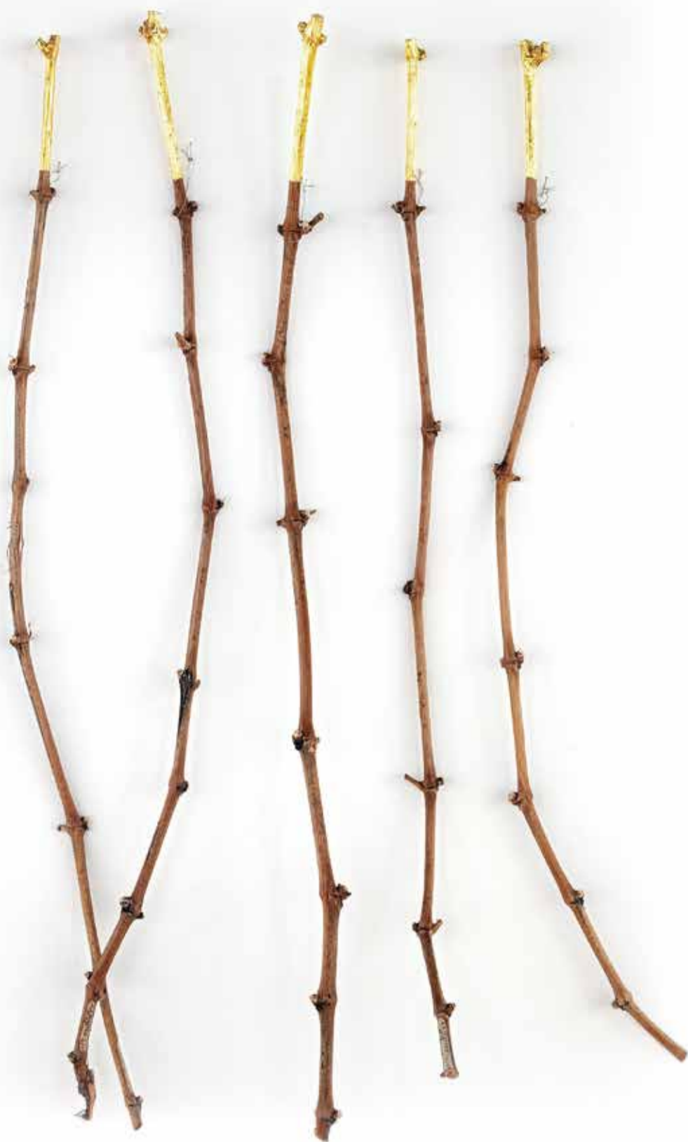
Sarment vergoldet, Ölvergoldung, 45cm, 2018